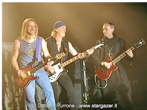
Steve Morse & Roger Glover (Deep Purple), Notker Wolf

Und – wie auch schon beim ersten Album „Rock my Soul“ – hat sich Dr. Notker Wolf, oberster Benediktiner weltweit und erklärter Fan von Jethro Tull, den Rolling Stones und Deep Purple, den Spaß nicht nehmen lassen, mit seinen ehemaligen Schülern des Ordens-Gymnasiums ins Studio zu gehen. Dass der „rockende Abt“ bei einem gemeinsamen Konzert mit Deep Purple dann auch noch bei „Smoke on the Water“ das weltbekannteste Gitarrenriff und mehr spielen durfte, war für alle Beteiligten ein „himmlisches“ Erlebnis.