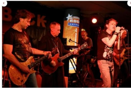
Abtprimas Dr. Notker Wolf mit der Band Feedback im Münchner Club 59:1