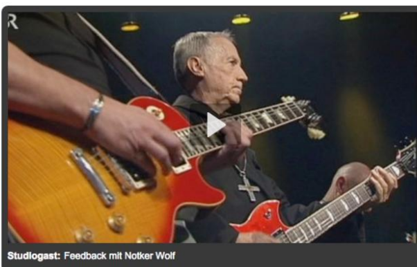
Studiogast: Feedback mit Notker Wolf