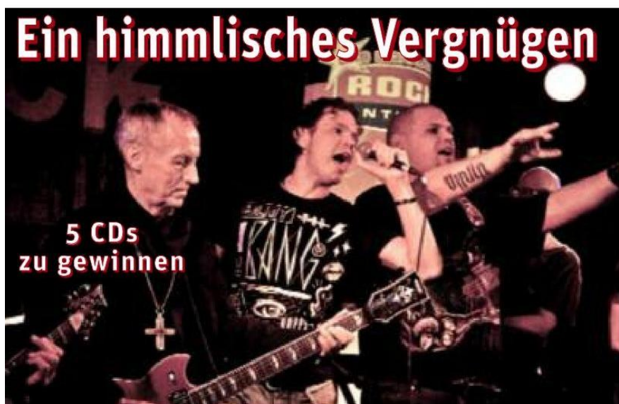
Und ewig rockt der Mönch: „Feedback“ mit dem 71-jährigen Abtprimas Notker Wolf.

MÜNCHEN. Einen überwältigenden Erfolg feierte die Rockgruppe FEEDBACK bei ihrem CD-Releasekonzert des neuen Albums „No Lies“ (Transformer Records/Membran, VÖ 27.4.) vor kurzem im Rock-Club 59:1. Immer noch aktiv dabei ist der 71-jährige Abtprimas Notker Wolf, der es sich nicht nehmen lässt, mit seinen ehemaligen Schülern der Klosterschule in St. Ottilien auf die Bühne zu gehen und den Songs mit seiner E-Gitarre und seiner Querflöte ei-