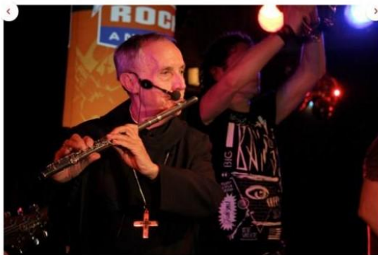
Abtprimas Dr. Notker Wolf mit der Band Feedback im Münchner Club 59:1